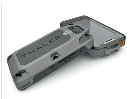
LTE™ Terminal von Thales.

Eine dritte wesentliche Eigenschaft bei taktischen Funksystemen betrifft die notwendige Robustheit der Endgeräte gegenüber Umwelteinflüssen, welche jedoch zu Abstrichen bei der Ergonomie führt. Die soeben genannten Eigenschaften sind für den Kampfeinsatz von zentraler Bedeutung. Allerdings zeigen sich diese dem militärischen Nutzer in «friedlichen» Übungen sowie auch bei subsidiären Einsätzen nicht. Er bemerkt vor allem den im Vergleich zum Smartphone fehlenden Komfort und die allenfalls fehlende Abdeckung in Form von fehlender Verbindung.